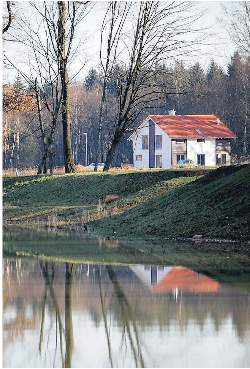
Erste Häuser stehen schon (rechte Seite auf dem Plan).