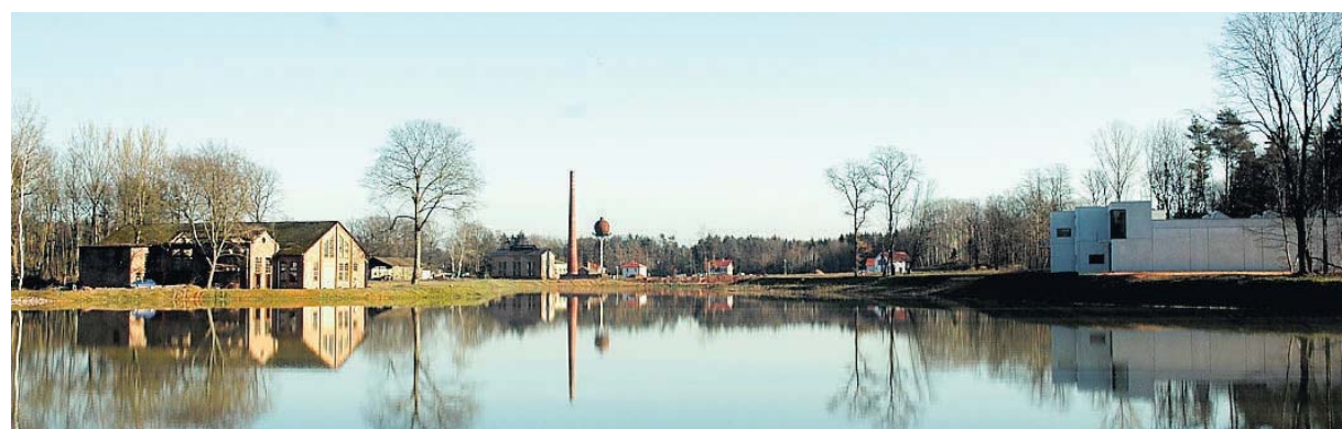
Der See mit dem Wahrzeichen Wasserturm (auf dem Plan Nummer zwei).