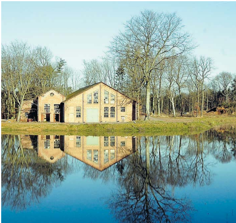
Die alte Backsteinhalle (Nummer vier auf dem Plan).